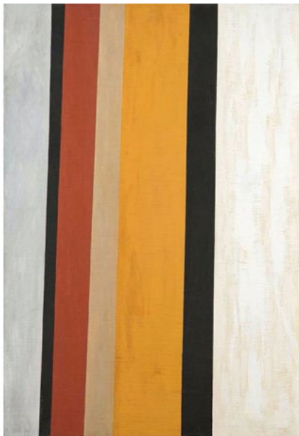
Рисунок 1. Транзитные каналы Элис Мейсон, 1996

Ее цвета тонко теплые и слегка исключительные. Вертикальные полосы не являются абсолютно прямыми или одинаковой толщины. Они слег-