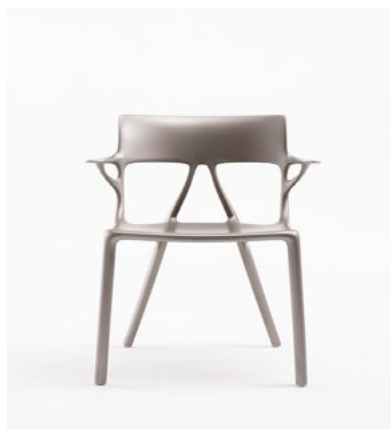
Рисунок 1. Стул AI от Старка для Kartell

Недавно на выставке Salone del Mobile в Милане совместно с компанией Kartell Старк представил кресло AI, которое стало первым в своем роде, созданным с помощью искусственного интеллекта. ИИ создаст новую свободу в дизайне. С помощью искусственного интеллекта можно задать любой запрос, но главное — знать правильный вопрос. Старк «видит» время за пределами мебели. «Дизайн в том виде, в котором мы его знаем, будет мертв», — говорит он. «Появятся лучшие решения для сидения, чем стул. Я думаю, что стул всегда ставил вас в неудобное физическое положение. Мы можем сделать лучше, чем стул».