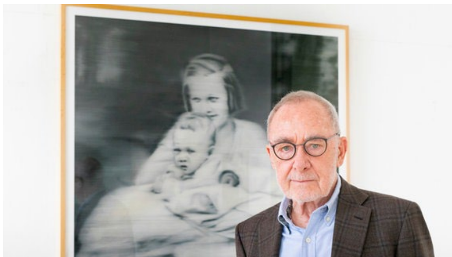
Рисунок 1. Герхард Рихард

ственный, сложный и разнообразный корпус работ, который всегда был очень хорошо принят», — говорит искусствовед и глава Дрезденского архива Герхард Рихтера Дитмар Эльгер, отдавая ему дань уважения. «Это уже исключительная ситуация, и он также исключительный художник», — говорит Эльгер, который лично знаком с Рихтером с 1980 года и опубликовал его биографию в 2002 году. В качестве выдающихся примеров своего творчества художник называет «48 портретов» и скандальный цикл картин «18 октября 1977 года».