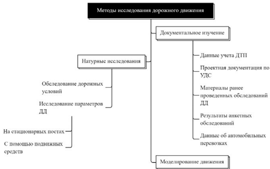
Рисунок 1. Классификация методов исследования дорожного движения

Метод документального изучения говорит сам за себя, он предполагает изучение данных без наблюдения объекта исследования. Материалами для