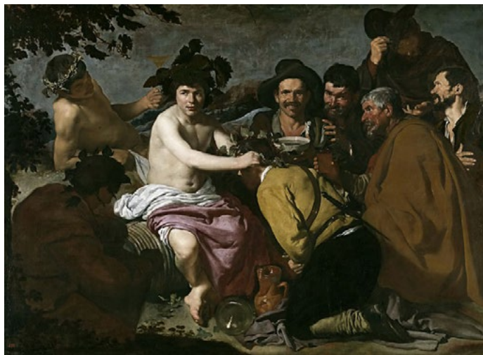
Рисунок 1. Картина «Пьяницы» Диего Веласкеса

Бакко сидит и выделяется своей позицией, своей наготой, светом, короной из виноградных листьев... Три стадии опьянения представлены благодаря выражениям персонажей.