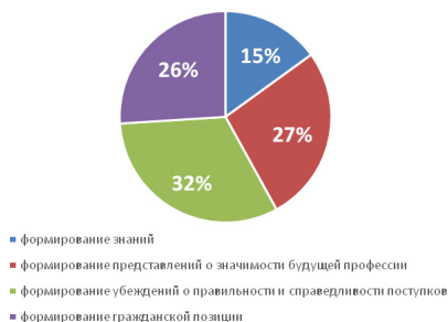
Рисунок 3. Результаты опроса о влиянии наставников на формирование различных сторон социальной ответственности курсантов (по мнениям курсантов).

Далее, опрос предполагал изучение влияния наставников на формирование различных сторон социальной ответственности (рисунок 3).