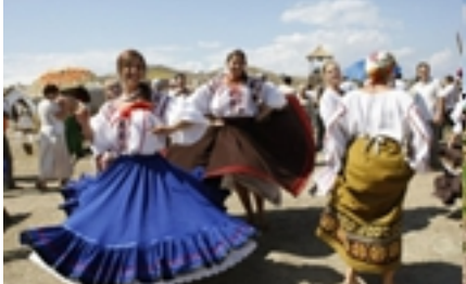
Рисунок 8. Гуляние в Атамань.