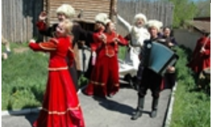
Рисунок 9. Гуляние в Атамань.