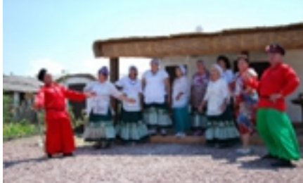
Рисунок 5. Станица Атамань, выступление казачков.