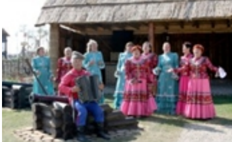
Рисунок 6. Станица Атамань, выступление казачков.