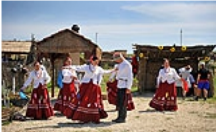
Рисунок 7. Гуляние в Атамань.