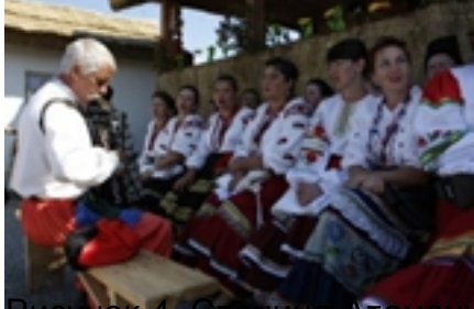
Рисунок 4. Станица Атамань, выступление казачков.