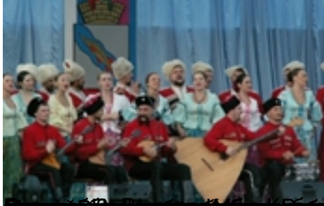
Рисунок 3. Украинский казачий хор, выступление казачьего хора.